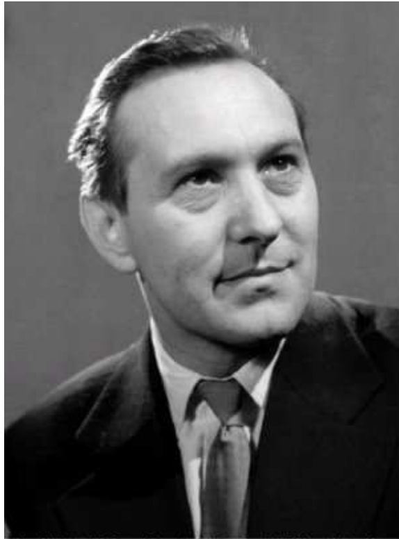
Budapest, 1955. május 15. – Bessenyei Ferenc utóművésze, aki a Kossuth-díj II. fokozatával tüntették ki a színházi tagjai alkalmából rendezett díjtadó ünnepségen.